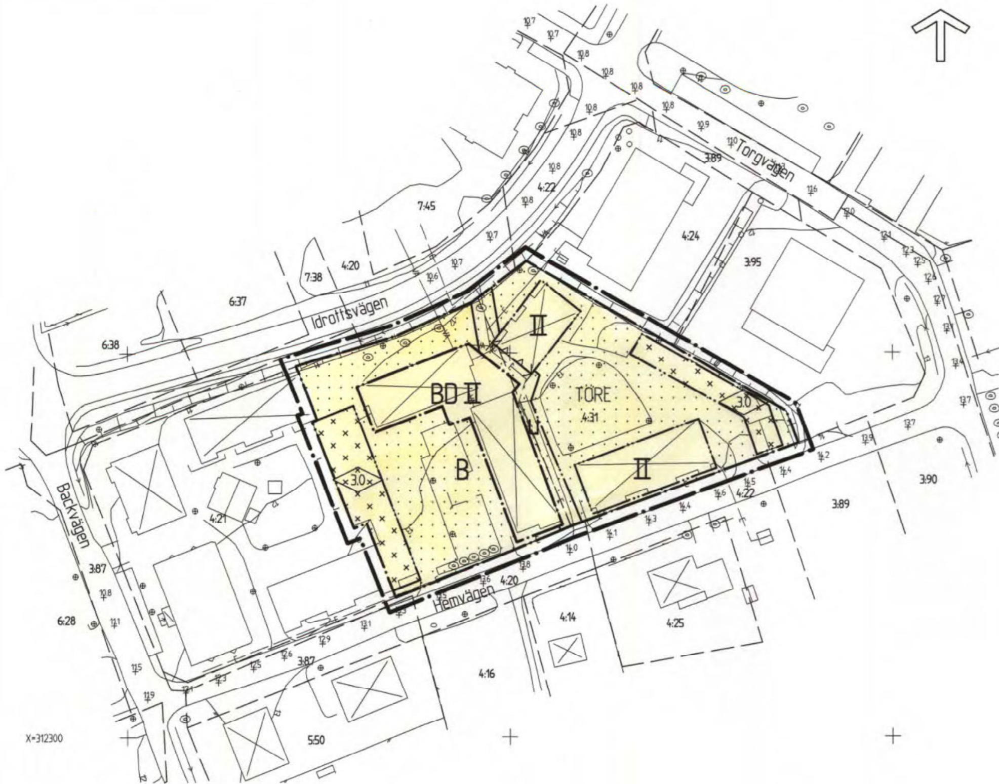
ILLUSTRATION SKALA 1:1000