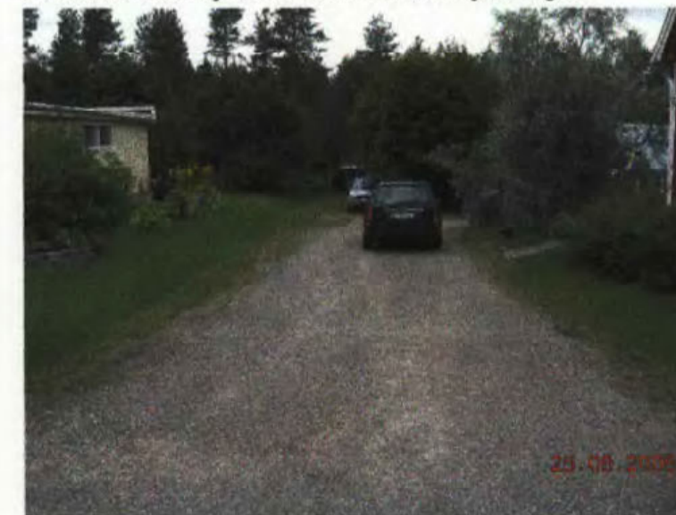
Foto Området mellan Gjutars 2 och 3 sett från Gjutarvägen