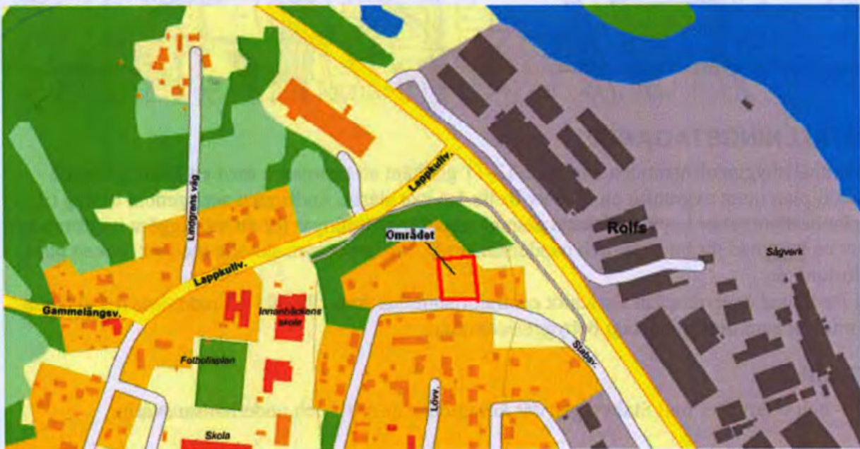
Figur 1 Översiktskarta