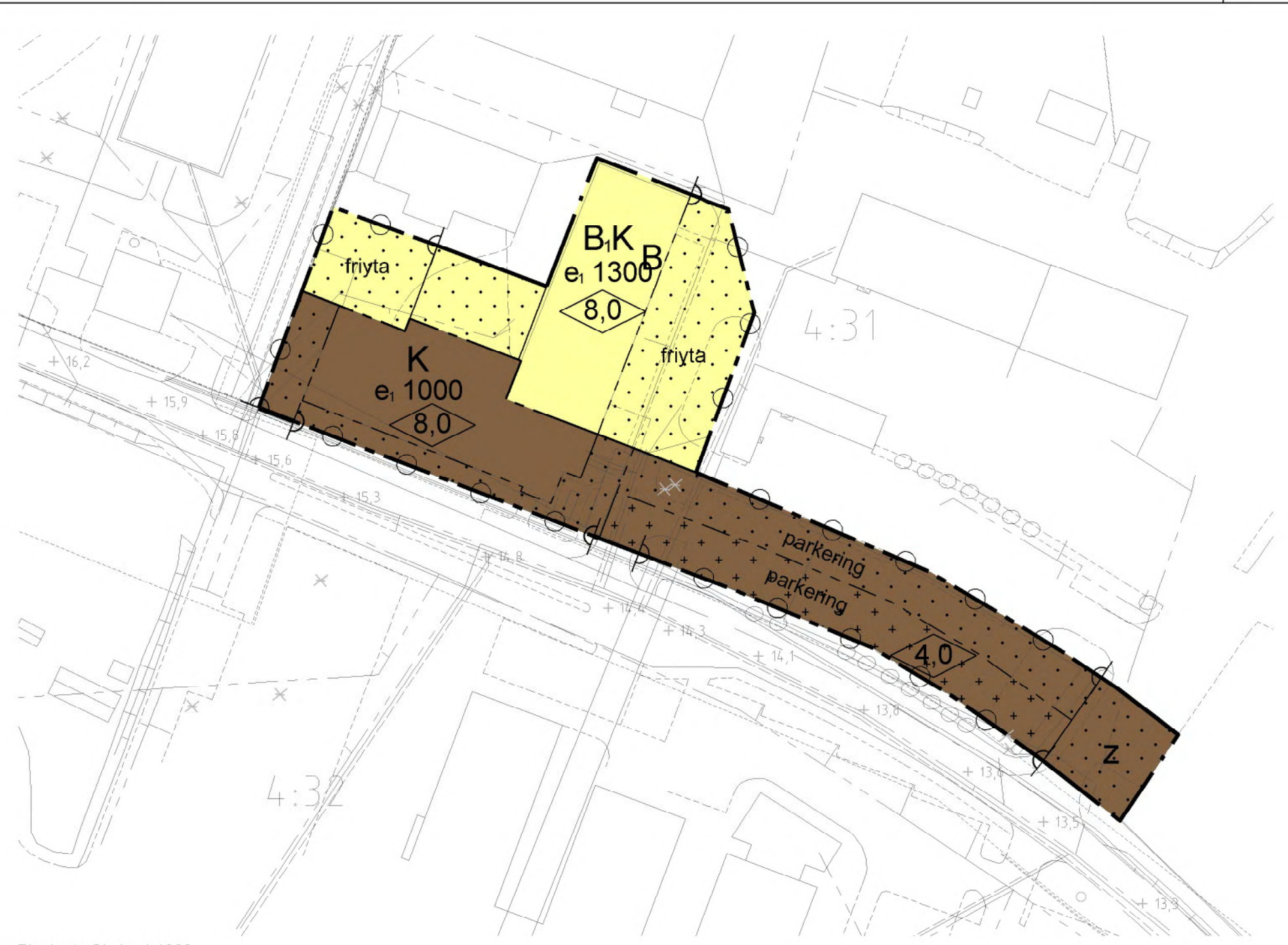
Plankarta Skala: 1:1000