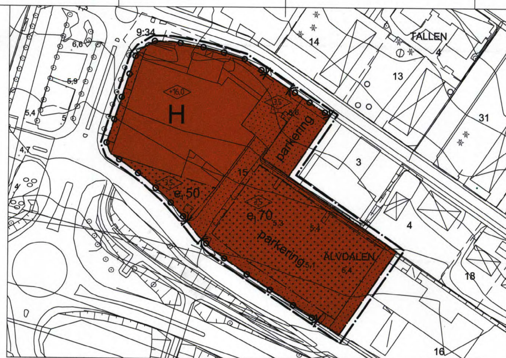
PLANKARTA SKALA 1:1000 (A2)