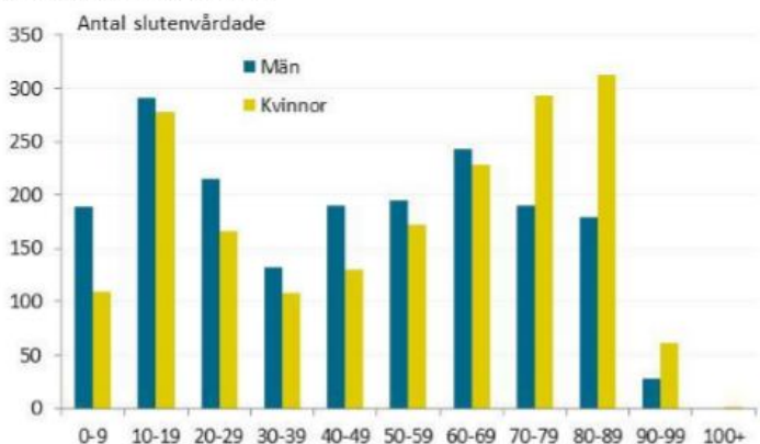
Figur 9. Antal slutenvårdade fotgängare i transportolyckor 2008 – 2012 efter ålder och kön. Källa: Patientregistret, Socialstyrelsen.

Som framgår av nedanstående figur är det i första hand yngre personer och äldre kvinnor som behöver slutenvård till följd av fotgängarolyckor under transport.