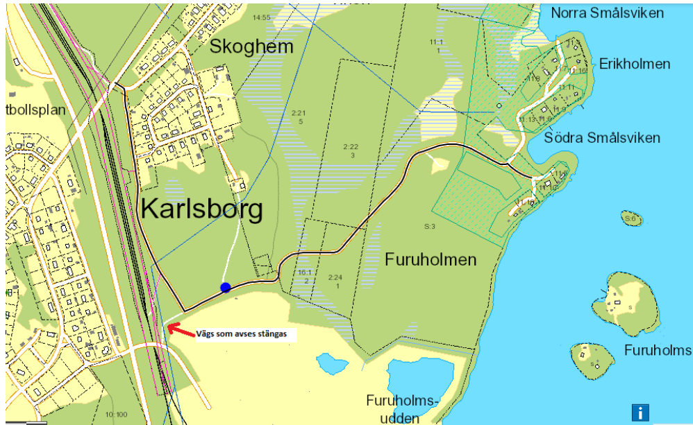
Gemensamhetsanläggning, Vånafjärden GA:1, blåmarkerad.

Ärendet har föredragits vid samhällsbyggnadsnämndens beredningsmöte, 27 november 2018 då det bestämdes att platsbesök skulle genomföras innan planprocessen startades.