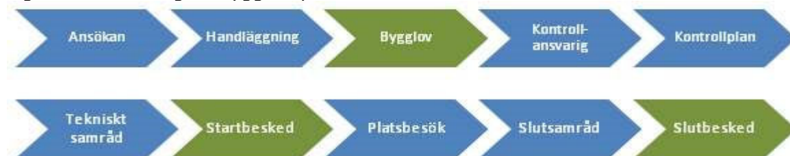
Figur 1 Beskrivning av bygglovsprocessen

Vilka steg ingår i hanteringen av en ansökan. En förenklad beskrivning av bygglovsprocessen redovisas i figur 1.