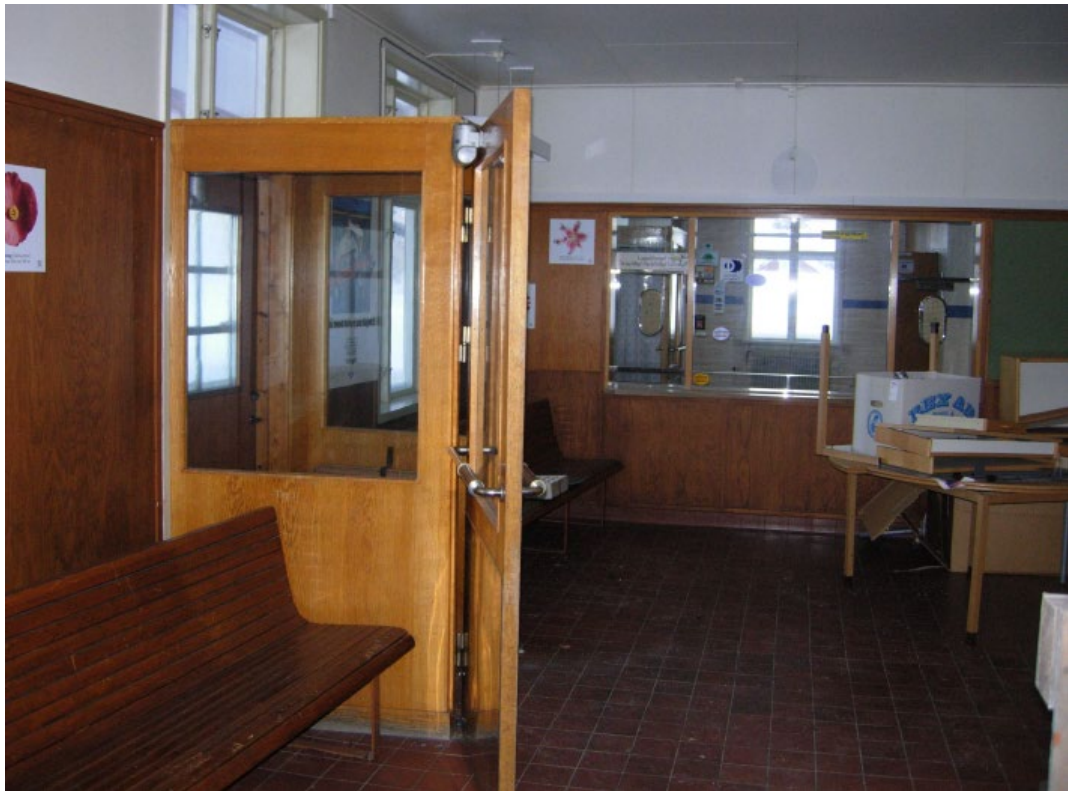
Väntsalen med biljettluckan i bakgrunden, 2 februari 2018.

Vid besöken kunde följande konstateras. Det finns tydliga tecken på att byggnaden har kallställts under några år, kraftig kondens på fönster i trapphus och övre plan och mögelpåväxt i delar av källaren och trapphuset upp till lägenheten. Källardörren och luckan till den outgrävda delen stod öppna, vilket gör att markfukt har fått direkt tillträde upp till övre plan genom trapphuset. Markplan var inte uppenbart berörd av någon fukt och endast färgen i godsrummets tak hade släppt. Mat var lämnad i kylskåpet i personalrummet så att det hade runnit ut från kylskåpet på golvet. Vindsplanet var i mycket gott skick och endast lite vatten hade tagit sig in vid takluckorna. Ventilationen i stationshuset sköts via självdrag. Ett flertal ventiler var delvis stängda vilket lett till en försämrad ventilation. Då murstockarna varit kalla på grund av att byggnaden kallställts, har ventilationen inte fungerat som den ska vilket är en bidragande orsak till förhöjd luftfuktighet och en ökad risk för mögeltillväxt.