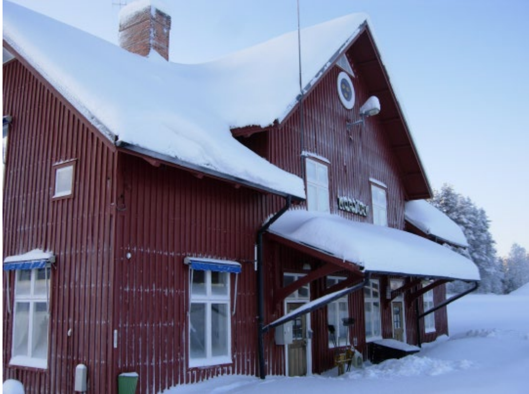
Morjärvs stationshus fasad mot bangården, 2 februari 2018.

Byggnadsinspektör från bygg- och miljöavdelningen och byggnadsantikvarie från Norrbottens museum har varit på besök i och runt byggnaden vid två tillfällen, 2 och 21 februari 2018. Vid besöken i byggnaden uppdagades bristande underhåll av byggnaden. Byggnaden har varit kallställd sedan 2015.